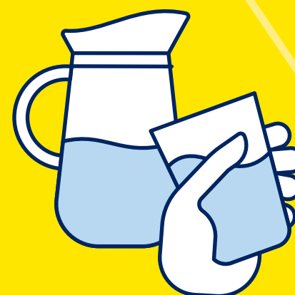
BUVEZ DE L'EAU