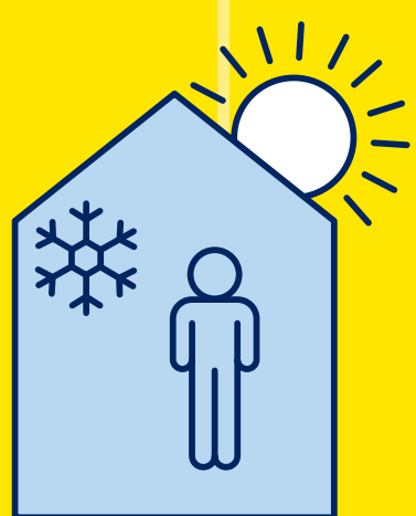
RESTEZ AU FRAIS