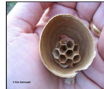
Nid de fondation

Octobre : le nid peut mesurer jusqu'à 1 m de haut !