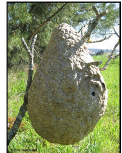
Nid en fin d'année

Les nids de taille importante, découverts entre janvier et mars ne sont plus habités et ne seront pas recolonisés au printemps suivant. Il n'est alors plus nécessaire de les faire détruire.